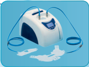
HILOTHERM Clinic für die stationäre Behandlung