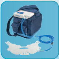
HILOTHERM Homecare für die mobile Behandlung des Sportlers, auch zuhause

Appliziert wird die thermische Wirkung mittels des Mediums Wasser. Dieses wird in den beiden speziell dafür konzipierten Therapie-Geräten 'HILOTHERM Clinic ' und 'HILOTHERM Homecare ' gradgenau auf die gewünschte Temperatur eingestellt und konstant auf diesem Wert gehalten.